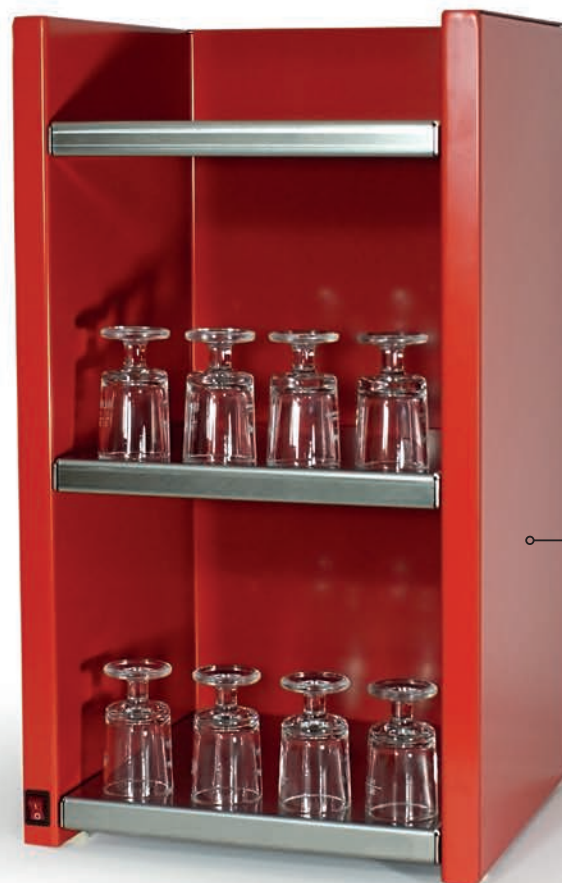
Modell HOT Cage S